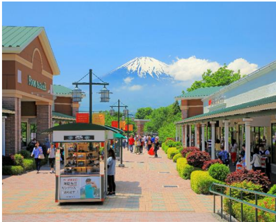
御殿場プレミアム・アウトレット